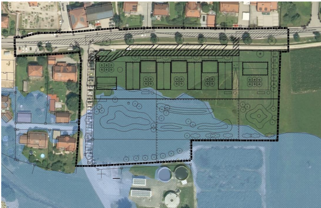
Bemessungshochwasser HQ 100 (blaue Darstellung),

Das Gebiet liegt jedoch teilweise im amtlich festgesetzten Überschwemmungsbereich des Further Baches.