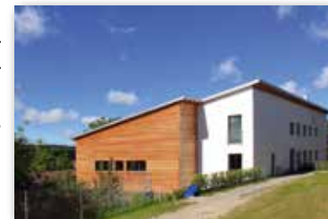
Krippe und Hort wurden stark erweitert