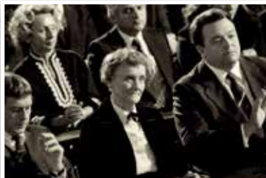
„Niemals Gewalt“ Verleihung des Friedenspreises an Astrid Lindgren 1978

Vor diesem Hintergrund möchte ich sagen, wie stolz ich auf Sie, die Further Bürgerinnen und Bürger bin. Rede ich mit den älteren von Ihnen erzählen Sie von der Vertreibung, dem Elend und den Flüchtlingen nach dem Ende des Zweiten Weltkrieges und das man helfen