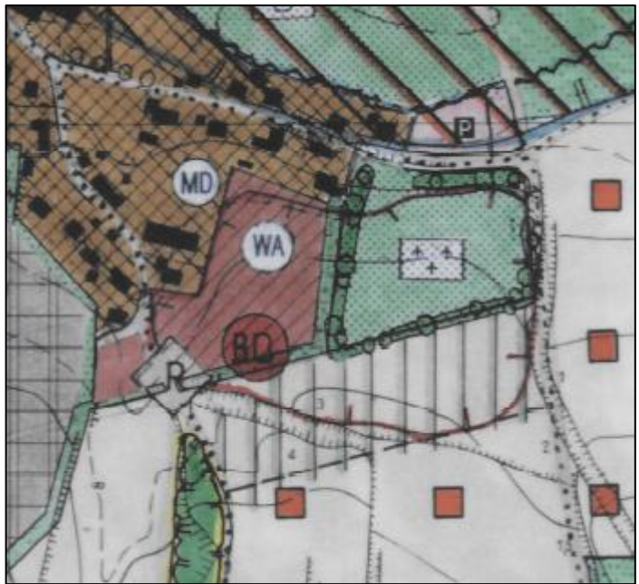
Abb. 3 Ausschnitt aus dem Flächennutzungsplan mit integriertem Landschaftsplan der Gemeinde Furth von 1996. Ohne Maßstab.

Im rechtskräftigen Flächennutzungsplan (siehe Abb. 3) ist der Großteil der Fläche westlich des Friedhofs bis zur Straße bzw. zur Bestandsbebauung als allgemeines Wohngebiet dargestellt. In der Lücke zwischen der bestehenden Bebauung am Hommerweg und an der Hochkreuterstraße findet sich ein Dorfgebiet. Am südlichen und östlichen Rand des allgemeinen Wohngebiets ist eine geplante Ortsrandeingrünung eingezeichnet. Südlich hiervon sowie südlich des Friedhofs wird der Bereich als mögliche Flächen für