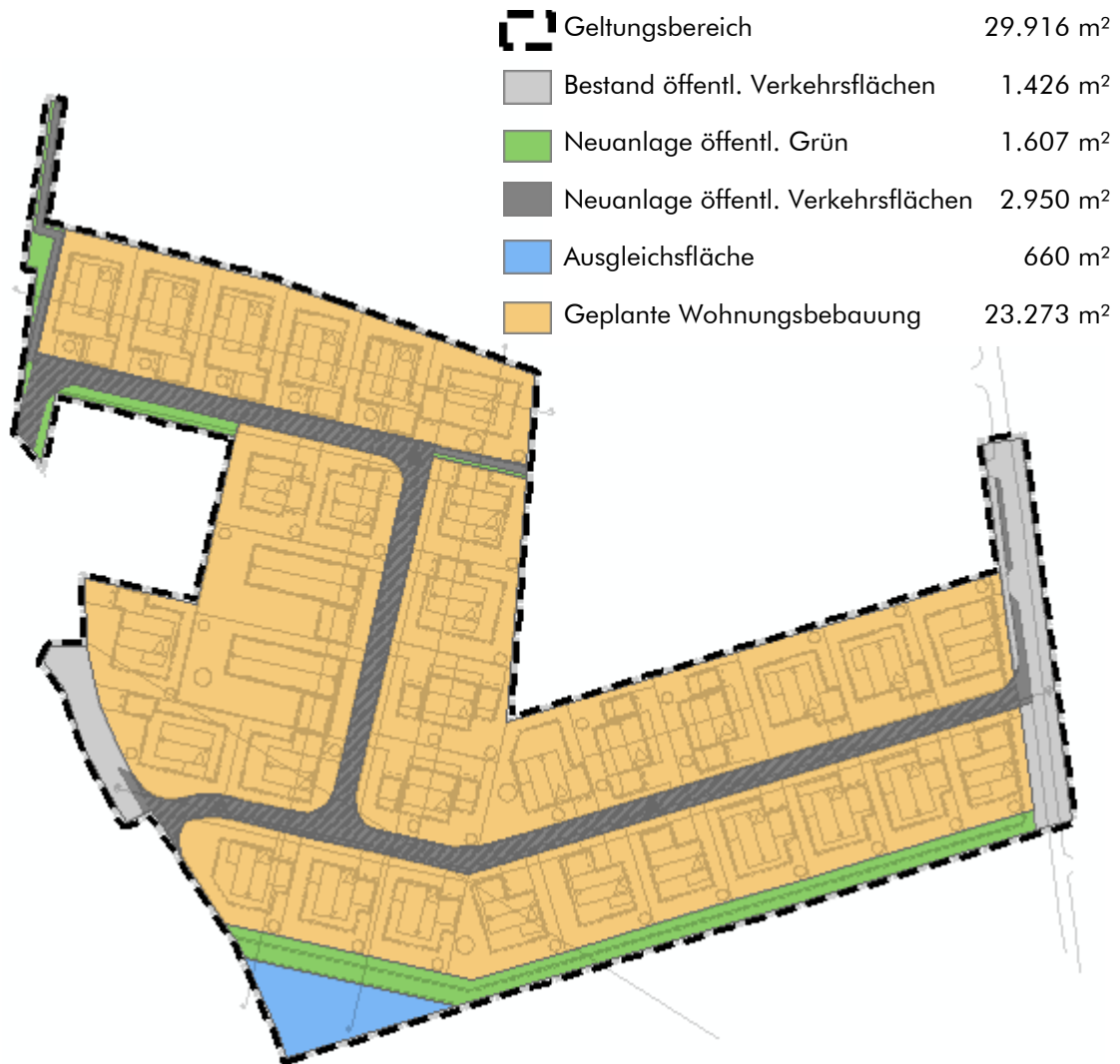
Abb. 4 Übersicht der verschiedenen Flächentypen im Geltungsbereich zur Ermittlung der Eingriffsfläche. Ohne Maßstab.

der verschiedenen Flächentypen. Die vollständige Flächenbilanzierung ist der Begründung zum Bebauungsplan zu entnehmen.