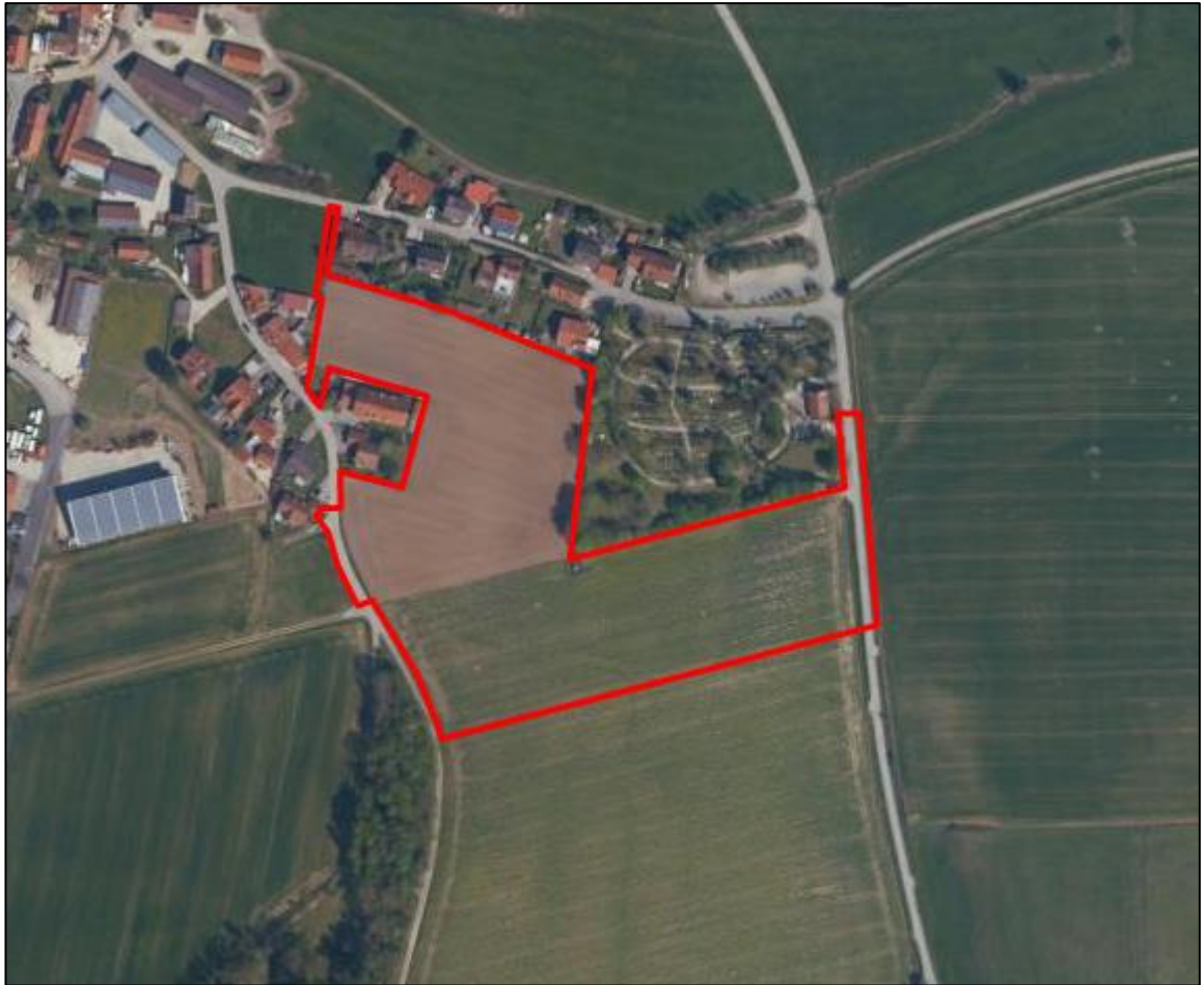
Abb. 1 Umgriff Bebauungsplan „Keramiksiedlung“ im Luftbild (rot). Ohne Maßstab.

Im Nordosten grenzt der örtliche Friedhof unmittelbar an das Gebiet, im Norden und Nordwesten die bestehende Bebauung. Der Großteil der Fläche wird derzeit intensiv ackerbaulich genutzt. Selbes gilt für die angrenzenden, nicht bebauten Flächen. Südwestlich an das Vorhaben angrenzend ist ein als Biotop kartiertes Gehölz situiert, welches zudem im Ökoflächenkataster eingetragen ist. Weitere Gehölze befinden sich am gesamten Rand des Friedhofs sowie vereinzelt in den benachbarten Gärten. Auf Flurstück Nr. 730 befindet sich im Norden ein Brunnen bzw. Grundwassermesspegel. Abb. 1 zeigt den Umgriff des Bebauungsplans im Luftbild.